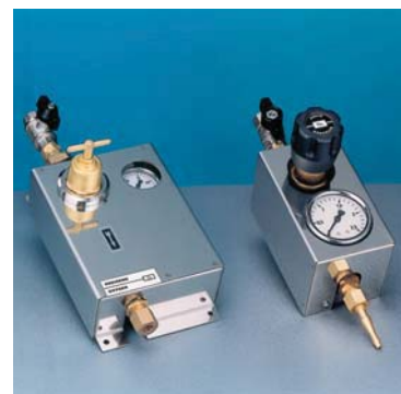
RAMPE MODULARI BREVETTATE MODULAR MANIFOLDS PATENTED