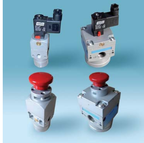
SCARICO AUTOMATICO FINE LINEA AUTOMATIC MECHANICAL DRAIN